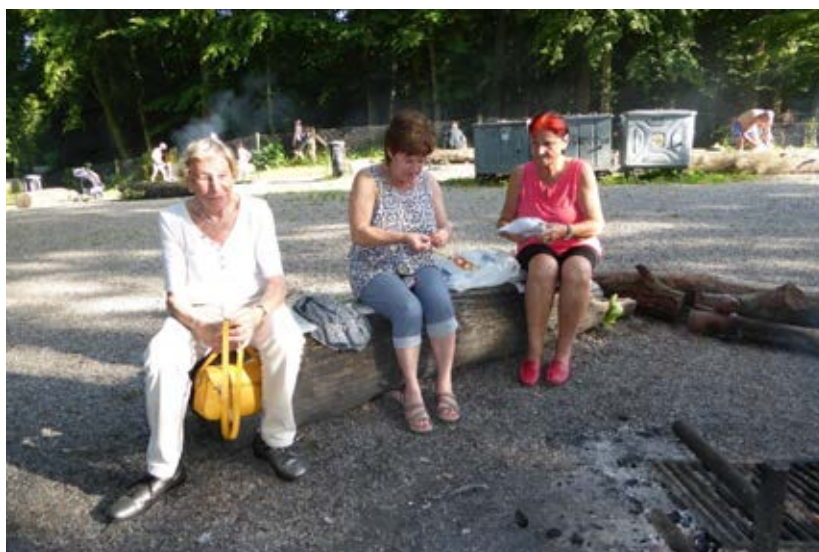
Die Seniorinnen rüsten das Bratgut