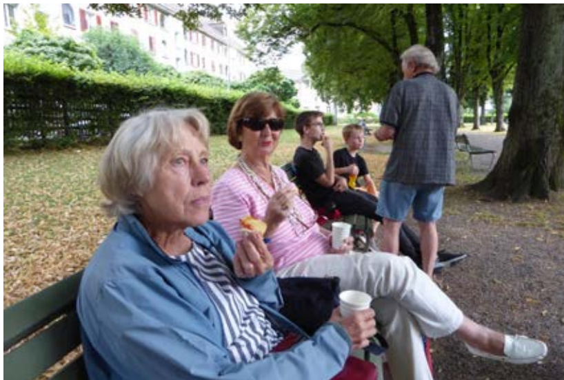
Noch schnell eine Stärkung vor dem Wettkampf